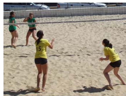
Amigos Cádiz vs. Amigos Cádiz