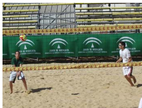
Juegan los campeones