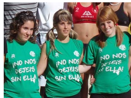
tercer equipo femenino

No defraudaron las expectativas, habida cuenta que el equipo cadete femenino había quedado el 4ª de Andalucía y los chicos en 7º lugar en el CADEBA celebrado en Sanlúcar de Barrameda el pasado fin de semana. En esta ocasión San Felipe Neri quedó 3º.