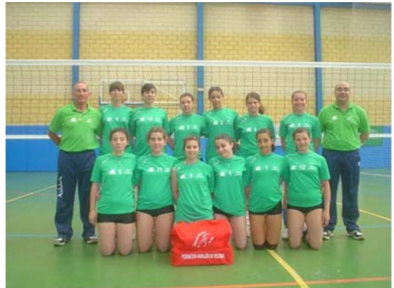
Equipo infantil de Andalucía

infantil masculino quedó en 4º puesto tras perder contra Murcia, quedando en esta ocasión Canarias como subcampeona y Murcia como campeona.